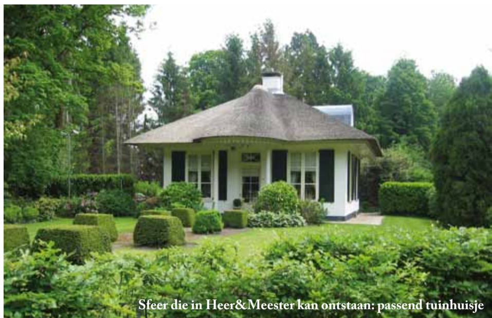
Sfeer die in Heer&Meester kan ontstaan: passend tuinhuisje

En dan komt het niet alleen aan op creativiteit, maar ook op geduld. “Een tuin heeft altijd wat tijd nodig om te ontwikkelen”, weet Arthur van Werkhoven. “Het jeugdige groen dat wordt aangeplant wordt na verloop van jaren meer en meer volwassen. Dat betekent dat de leefomgeving hoe langer hoe groener wordt en dat de kwaliteit ervan steeds toeneemt. Ik ben ervan overtuigd dat Heer&Meester over een paar jaar een sfeer oproept die aan Wassenaar doet denken!”